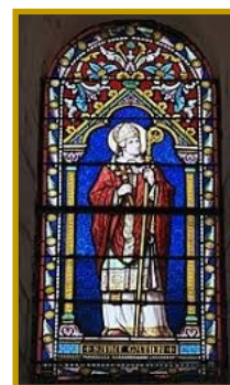
Fêté le 18 décembre

Il semble toutefois peu probable de faire remonter l'épiscopat de Gatien à l'an 250 et il est douteux de lui attribuer, à la suite de Grégoire de Tours, un épiscopat de cinquante années et une vacance de trente-sept années à compter de sa mort (304 ?). L'épiscopat de saint Gatien et celui de son successeur saint Lidoire (Litorius 341-371) ne sont guère antérieurs à la première moitié du IV e siècle. Ainsi l'établissement du christianisme en Touraine serait peut-être postérieur à la décision de 313 à Milan par les empereurs Constantin et Licinius proclamant la liberté des cultes dans l'Empire.